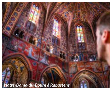
Notre-Dame-du-Bourg à Rabastens