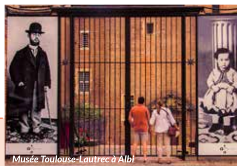
Musée Toulouse-Lautrec à Albi